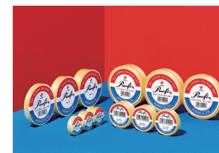
株式会社ニチパン Panfix