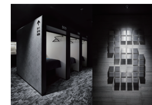
株式会社グローバル・エージェンツ THE Millennials