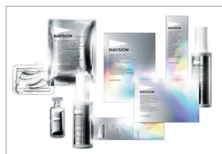
資生堂ジャパン株式会社 NAVISION